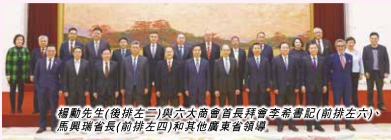
楊勳先生(後排左二)與六大商會首長拜會李希書記(前排左六)、馬興瑞省長(前排左四)和其他廣東省領導。