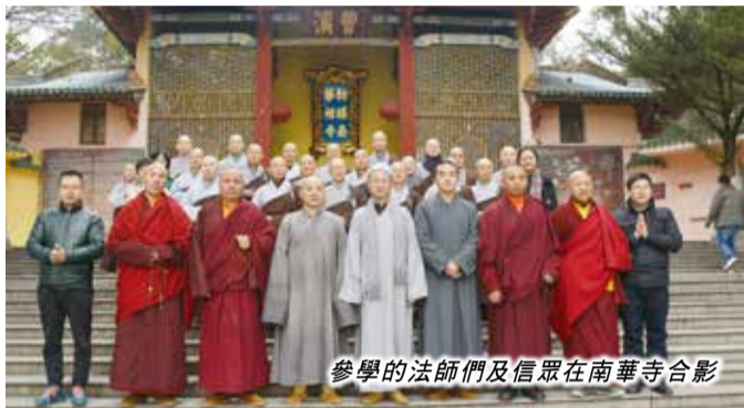
參學的法師們及信眾在南華寺合影