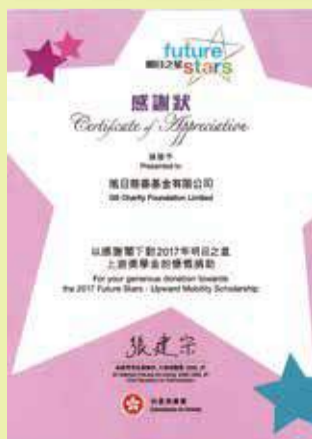
扶貧委員會頒發的感謝狀