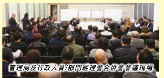
管理局及行政人員/部門經理會合併會會議現場

楊釗先生指出，落實工作主要在於「策略」與「心態」。策略上我們要分析局面，學習別人成功的經驗，總結自己的經驗，找出需要改善的地方。心態上，我們在面對問題時，到底是用樂觀正面的心態，還是用悲觀負面的心態呢？要成功落實工作，我們必須顧全大局，摒除負面和不肯吃虧的心態。