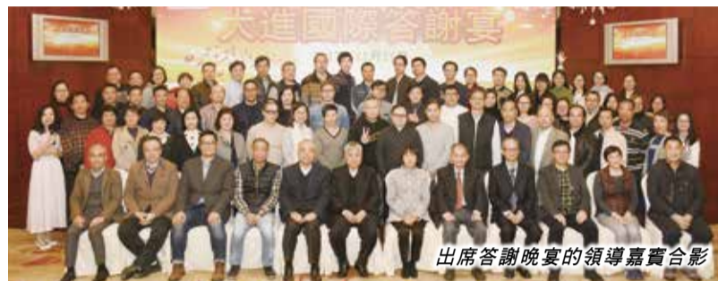
出席答謝晚宴的領導嘉賓合影

大進國際陪伴集團經歷了四次轉型。2016年中國進入十三五規劃年代，十三五規劃主題為「調結構、轉方式、促創新」集團亦隨著大時代發展巨輪進行調整，把出口貿易及洋行業務進行大合併，大進公司也光榮完成了歷史任務，功成身退。