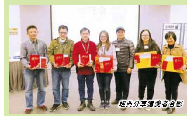
經典分享獲獎者合影

分享的經典作品主要有以下： 書籍《魯濱遜漂流記》故事告訴我們不論何時何地，不管遇到多大的困難，要勇敢面對，克服困難。只有這樣，才能獲得最終的勝利。 影片《可愛的你》改編自真實故事，是很典型的溫情勵志結構，執著堅毅的正能量，表達出無私大愛傳遞給更多的人。 影片《岡仁波齊》故事中告訴我們：企業經營也需要大家有共同的信仰，有共同的目標，相同的思想和認知，才會更好與公司融為一體。 書籍《騰訊傳》告訴我們：如今外表風光，業績優秀的騰訊公司，它的生存同樣面臨著被擠兌、被淘汰的風險。書中從各個角度，各個層面都透露出，原來勇於面對困難、勇於挑戰、勇於創新才是致勝的好招數。