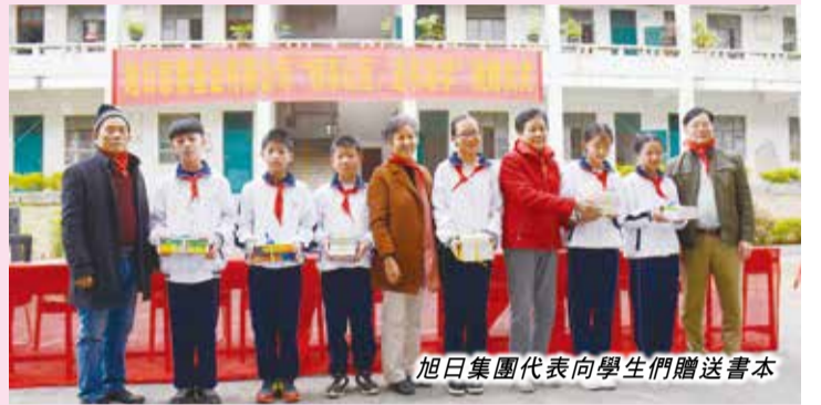
旭日集團代表向學生們贈送書本