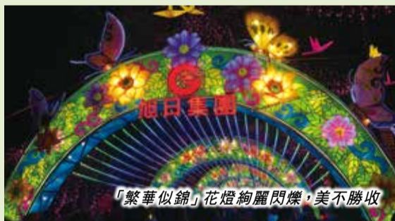
「繁華似錦」花燈絢麗閃爍，美不勝收