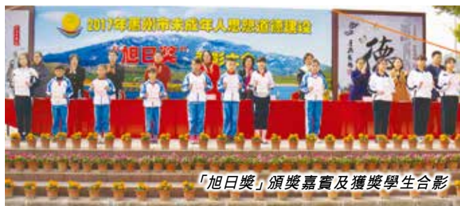
「旭日獎」頒獎嘉賓及獲獎學生合影

惠州市未成年人思想道德建設「旭日獎」是惠州市人民政府與香港旭日集團共同設立的市級獎項，亦是惠州市未成年人思想道德建設一大品牌。 特約通訊員