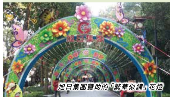
旭日集團贊助的「繁華似錦」花燈

今年西湖花燈展出時間長達67天，為歷屆最長。去年西湖花燈觀燈人數突破200萬人次，而今年觀燈人數有望超過去年，值得前往欣賞。 特約通訊員