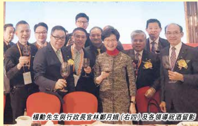
楊勳先生與行政長官林鄭月娥(右四)及各領導祝酒留影

在合作交流會上，楊勳先生與工商團體領袖及粵港澳兩地政府領導共同高歌《中國人》和《歌唱祖國》，展現了香港珠三角工商業界勤奮拼搏、自強不息的精神和愛國愛港的情懷。 特約通訊員