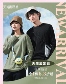
真維斯天貓官方旗艦店新風尚海報

在多渠道推廣方面，通過微信、微博、準點推送、直播間宣傳預告等方式提前發佈優惠信息，引導粉絲用戶提前關注本場直播，做好活動前的充分預熱。新風尚活動期間，真維斯天貓直播間圍繞活動主題、促銷優惠和時下熱點資訊展開，為粉絲推選優品及搭配的同時，通過熱點話題交流與粉絲拉近距離，不斷優化用戶的購物體驗，效果頗佳。此外，線下門店已與線上同期上架秋季新款，進一步做好秋季新品的推廣宣傳工作。 真維斯兩司推廣部