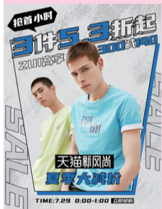
真維斯天貓官方旗艦店夏季促銷海報

在多渠道推廣方面，通過微信、微博、準點推送、直播間宣傳預告等方式提前發佈優惠信息，引導粉絲用戶提前關注本場直播，做好活動前的充分預熱。新風尚活動期間，真維斯天貓直播間圍繞活動主題、促銷優惠和時下熱點資訊展開，為粉絲推選優品及搭配的同時，通過熱點話題交流與粉絲拉近距離，不斷優化用戶的購物體驗，效果頗佳。此外，線下門店已與線上同期上架秋季新款，進一步做好秋季新品的推廣宣傳工作。 真維斯兩司推廣部