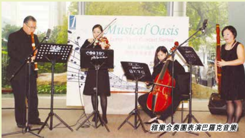
雅樂合奏團表演巴羅克音樂

由旭日集團及通利琴行攜手贊助的《都市中的綠洲》午間音樂會於3月23日載譽歸來，一連兩日於「一號九龍」舉行，為附近上班族送上美妙音樂。《都市中的綠洲》午間音樂會於去年11月首次在「一號九龍」舉行了一系列三場音樂會，由此拉開了精彩序幕，大受「一號九龍」及附近大廈工作的人士歡迎，掀起熱話。