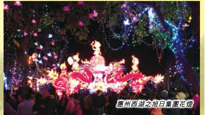
惠州西湖之旭日集團花燈

物超所值是真維斯的市場策略，也同樣是我們對這場演講的體會，沒有空泛的大話，只有平實的事實；沒有擺架子的企業家，只有親切而又充滿睿智的長者；這裡同樣沒有眼淚哭喊表情包，有的，是同學們臉上最真摯的微笑和手中最熱烈的掌聲，在這裡也同樣祝福楊勳先生和真維斯，願愛一直在！