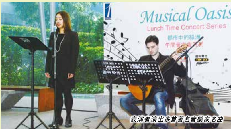
表演者演出多首著名音樂家名曲