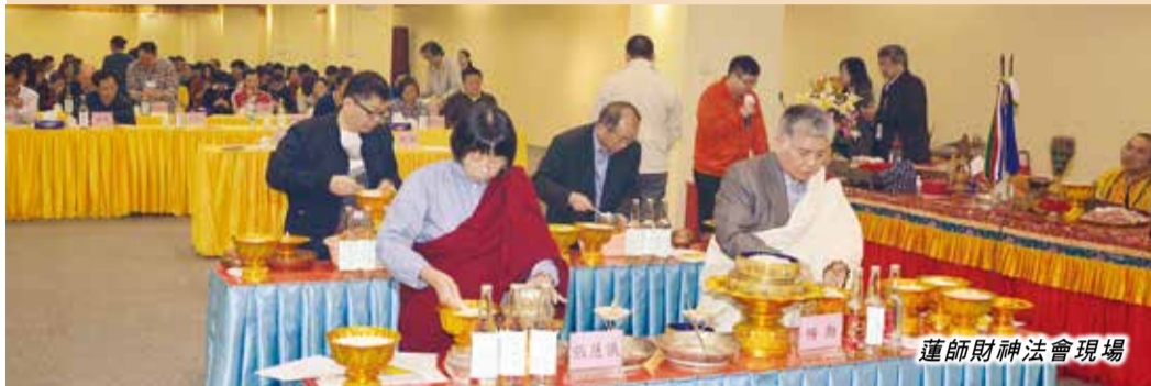
蓮師財神法會現場