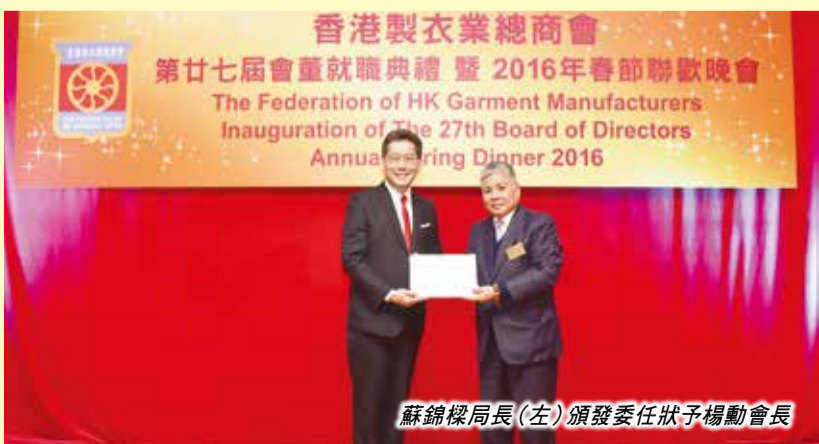
蘇錦樑局長(左)頒發委任狀予楊勳會長

當晚，出席的嘉賓尚有中聯辦經濟部副部長兼貿易處負責人楊益、經濟部副巡視員楊文明，立法會議員梁君彥和鍾國斌等。傳訊及公關部