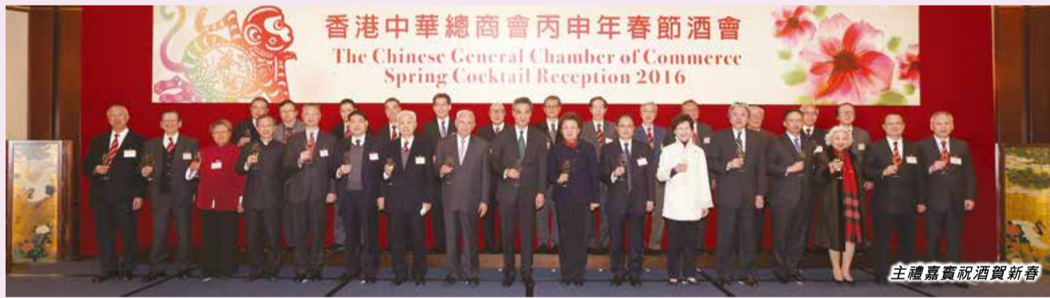
主禮嘉賓祝酒賀新春