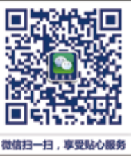
微信掃一掃，享受貼心服務

隨著互聯網帶來的巨大變化，基於移動互聯網的新媒體逐漸成為現代企業營銷推廣的重要媒介，特別是以App、微博、微信為代表的新媒體。在新形勢下，真維斯根據目標顧客群的消費習慣、行為習慣積極調整推廣策略，在做好傳統營銷的同時，借助新媒體力量，將真維斯的品牌特性精準地傳遞出去，在更多的目標消費者心目中建立真維斯年輕、健康、向上的品牌形象。