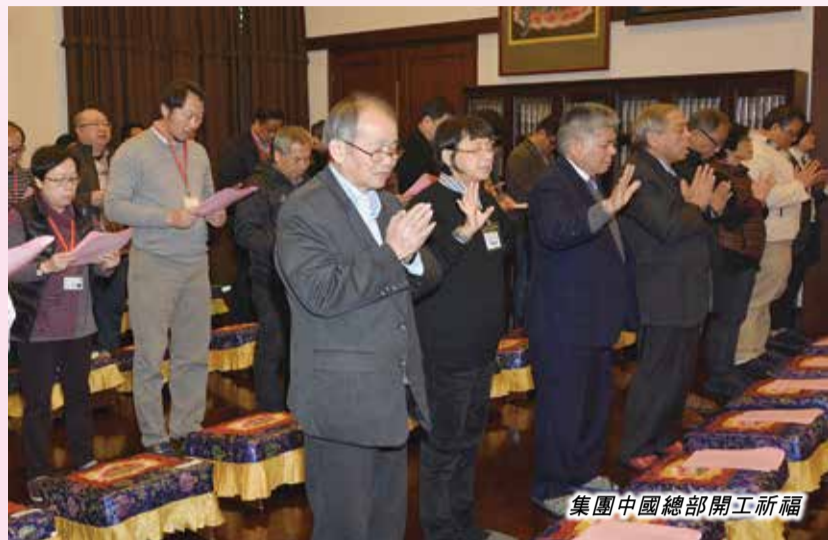
集團中國總部開工祈福