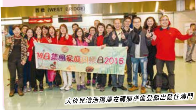
大伙兒浩浩蕩蕩在碼頭準備登船出發往澳門