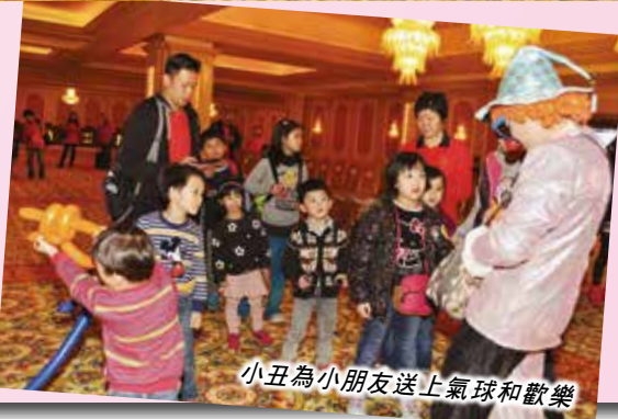
小丑為小朋友送上氣球和歡樂