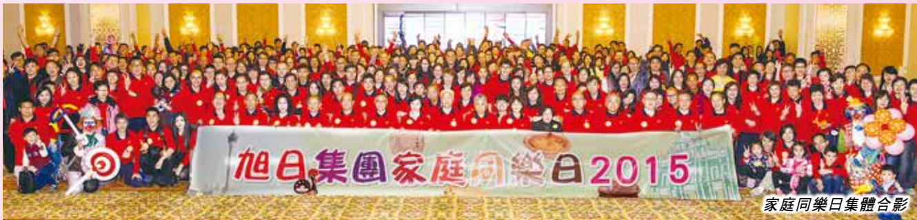
家庭同樂日集體合影

「魔幻間」的同事一睹多位身懷驚世獨門秘技的國際級魔術大師的風采，連環觸動全場觀眾的感官神經，絕無半點喘息空間，在90分鐘的奇幻舞台藝術體驗中，贏盡同事們的詫異讚美。 伴隨著兩個精彩大型表演的完美謝幕，旭日集團家庭同樂日2015圓滿結束。 傳訊及公關部