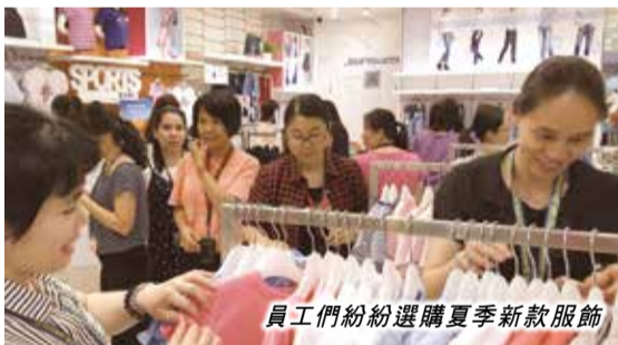
員工們紛紛選購夏季新款服飾