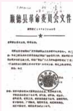
順德縣革委會1979年6月12日直接報送廣東省革委會習仲勳主任、楊尚昆副主任的043號文件