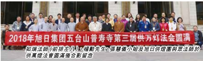
2018年旭日集團五台山普壽寺第三屆供萬燈法會圓滿