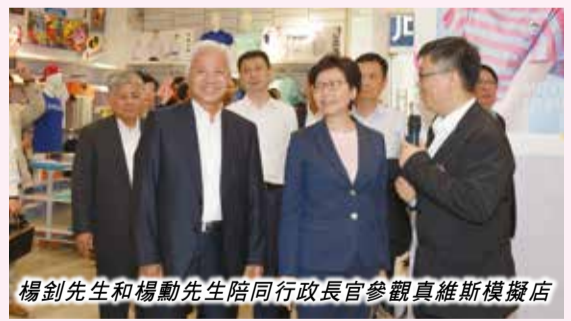
楊釗先生和楊勳先生陪同行政長官參觀真維斯模擬店