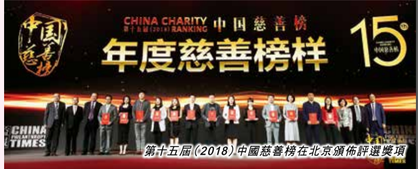
第十五屆（2018）中國慈善榜在北京頒佈評選獎項