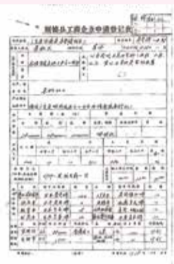
順德縣容奇鎮製衣廠的容字084營業執照