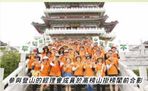
參與登山的經理會成員於高榜山掛榜閣前合影

《Return To Zero》和《逆流》奪得銀獎，《想像空間》、《罔》、《Who Are You》獲得銅獎；《歸零計劃》等十個作品獲得優秀獎。