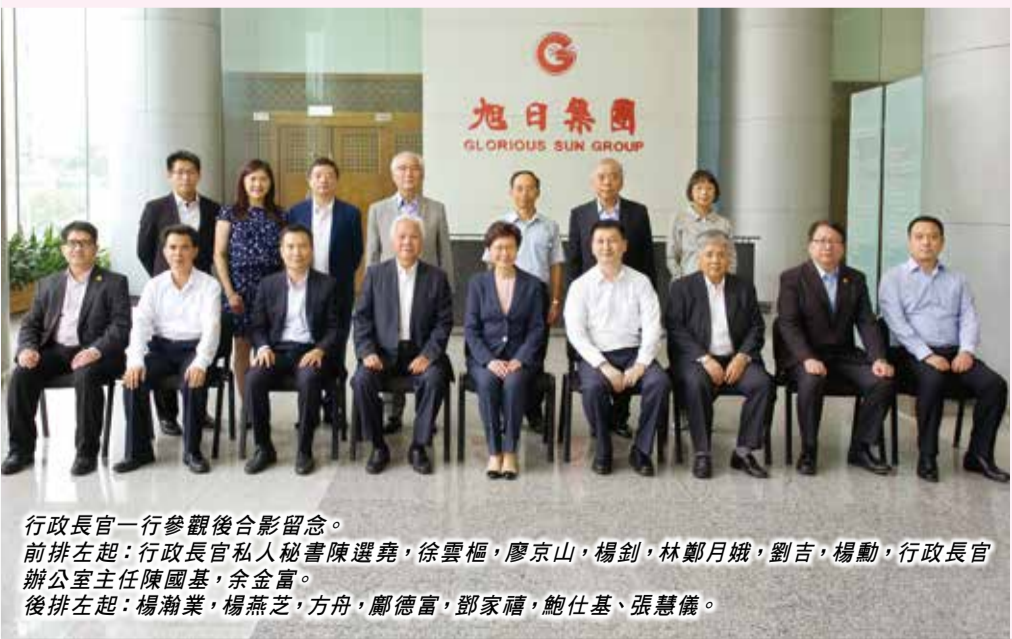
行政長官一行參觀後合影留念。 前排左起：行政長官私人秘書陳選堯，徐雲樞，廖京山，楊釗，林鄭月娥，劉吉，楊勳，行政長官辦公室主任陳國基，余金富。 後排左起：楊瀚業，楊燕芝，方舟，鄭德富，鄧家禧，鮑仕基，張慧儀。