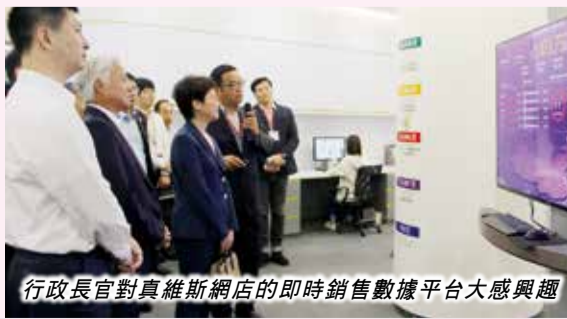
行政長官對真維斯網店的即時銷售數據平台大感興趣