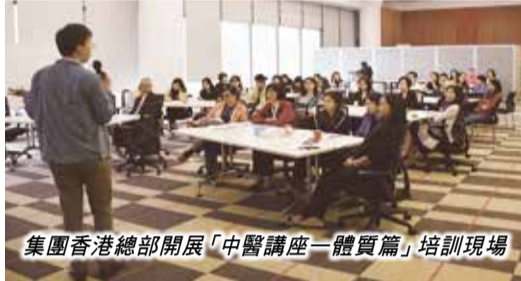
集團香港總部開展「中醫講座一體質篇」培訓現場