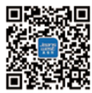
真維斯官方微信二維碼

6月1日至10日，VIP顧客在全國真維斯店鋪一次性購物滿168元，即可獲得40元優惠券，還有機會贏取真維斯為VIP客戶特別訂制的終極大獎——上海迪士尼樂園4天3夜「趣遊總動員」之旅！