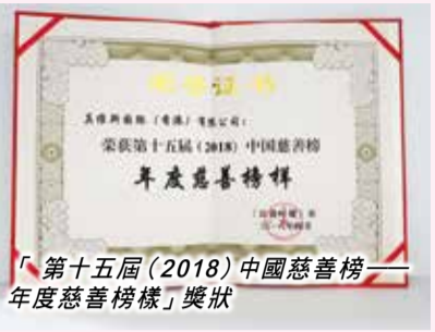
第十五屆（2018）中國慈善榜——年度慈善榜樣獎狀

憑藉年度公益支出、公信力、社會影響力、品牌傳播等指標的評選，真維斯國際（香港）有限公司被評為「2018中國慈善榜——年度慈善榜樣」。在第十五屆中國慈善榜慈善企業中，捐款排名第十三名。