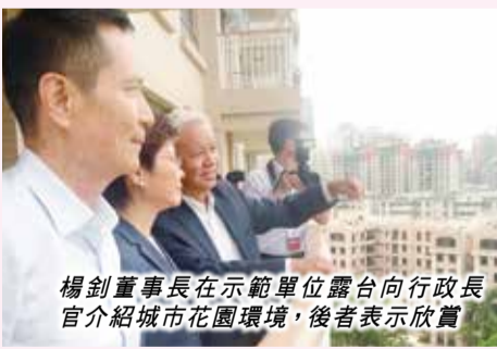
楊釗董事長在示範單位露台向行政長官介紹城市花園環境，後者表示欣賞