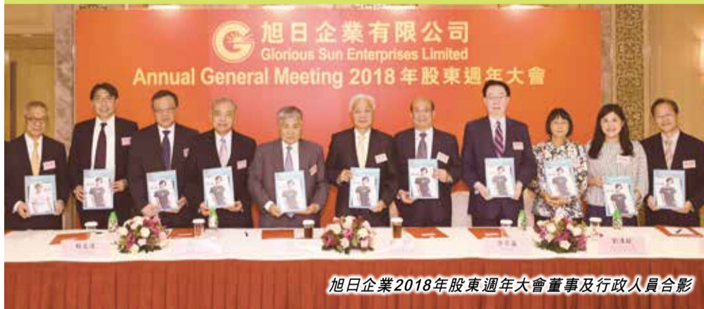
旭日企業2018年股東週年大會董事及行政人員合影