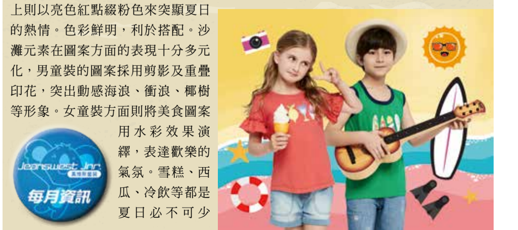
沙灘歡樂頌 商品開發部

男女童裝在色彩方面非常吻合主題。男童裝顏色亮麗，以黃綠色為主，演繹繽紛的夏日。而女童裝顏色上則以亮色紅點綴粉色來突顯夏日的熱情。色彩鮮明，利於搭配。沙灘元素在圖案方面的表現十分多元化，男童裝的圖案採用剪影及重疊印花，突出動感海浪、衝浪、椰樹等形象。女童裝方面則將美食圖案用水彩效果演繹，表達歡樂的氣氛。雪糕、西瓜、冷飲等都是夏日必不可少