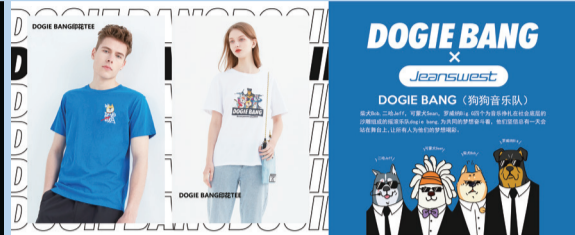
真維斯與DOGIE BANG新款聯名T恤系列