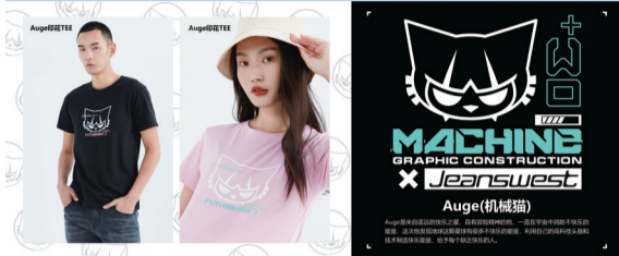
真維斯與AUGE機械貓新款聯名T恤系列