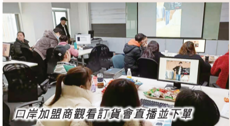
口岸加盟商觀看訂貨會直播並下單

因為受到過年期間疫情的再次影響，公司積極響應政府號召，努力做到少聚集，本次訂貨會採用了線下與線上直播結合的形式舉行，得到客戶的理解與積極的支持，直播當天獲得了滿意的直播效果，廣東地區加盟商在現場觀看直播，同時能夠直觀感受款式及面料，對這種形式給予了廣泛的好評。自2020年秋季訂貨會首次採用直播訂貨的形式後，公司即從客戶角度出發，進行了包括平台功能、直播內容及畫面清晰度等多方面的改善，大家也為特殊時期公司的快速應變能力點讚，對與我司這樣積極努力和正能量的公司合作感到放心。