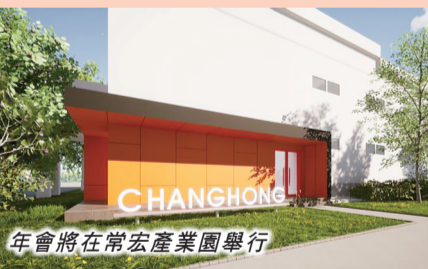
年會將在常宏產業園舉行