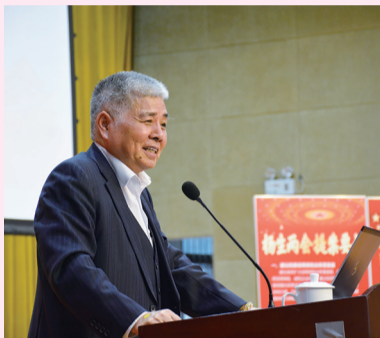
楊勳先生向觀眾作熱情洋溢的演講