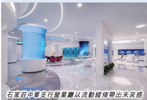
石家莊中華支行營業廳以流動線條帶出未來感

作為商業店舖建設與管理集成運營商，常宏攜手中國工商銀行，打造全新的智能化網點，尊重客戶個人化需求，增強客戶體驗感，先後為中國工商銀行中華支行5G智慧銀行、中國工商銀行和平支行提供設計服務。