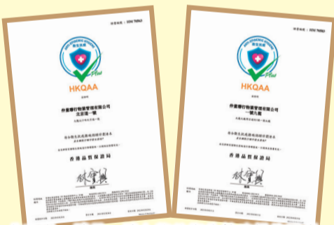
北京道一號及一號九龍的衛生防疫措施證書