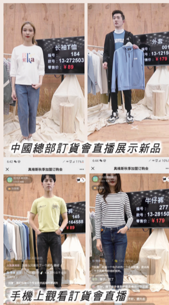
中國總部訂貨會直播展示新品