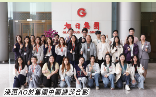
港惠AO於集團中國總部合影