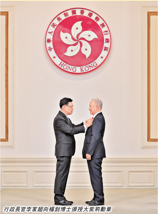
行政長官李家超向楊釗博士頒授大紫荊勳章