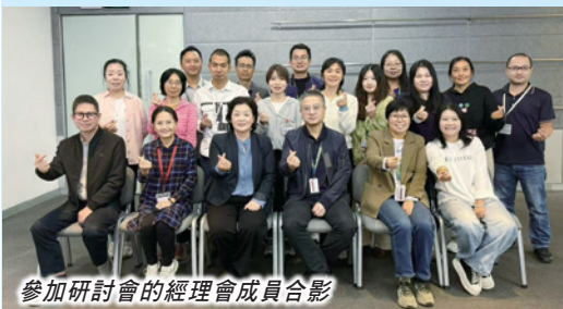
參加研討會的經理會成員合影