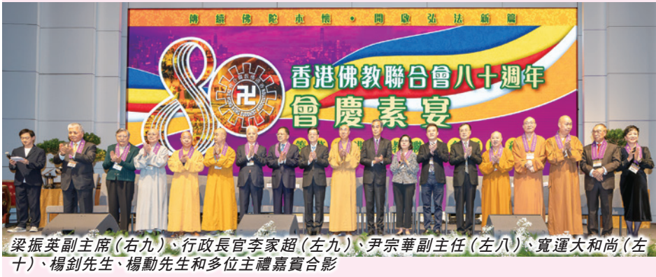
梁振英副主席（右九）、行政長官李家超（左九）、尹宗華副主任（左八）、寬運大和尚（左十）、楊釗先生、楊勳先生和多位主禮嘉賓合影