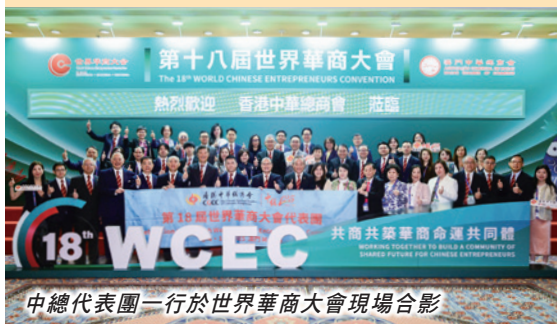
中總代表團一行於世界華商大會現場合影