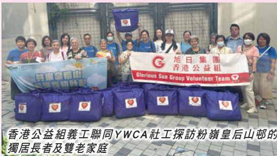
香港公益組義工聯同YWCA社工探訪粉嶺皇后山邨的獨居長者及雙老家庭