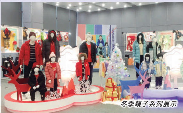
冬季親子系列展示