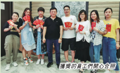
獲獎的員工們開心合照