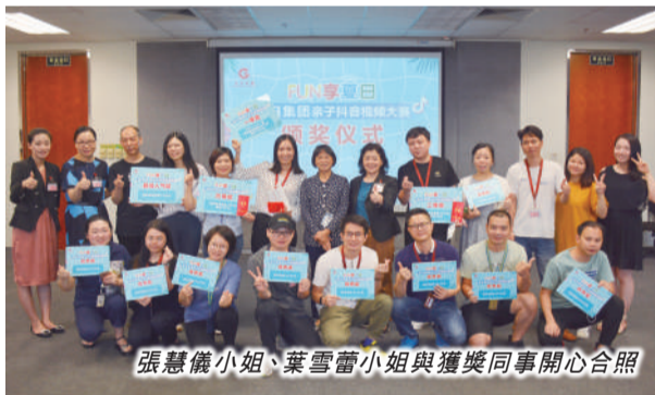
張慧儀小姐、葉雪蕾小姐與獲獎同事開心合照