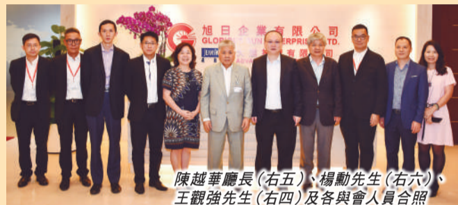
陳越華廳長(右五)、楊勳先生(右六)、王觀強先生(右四)及各與會人員合照

陳越華廳長回應時表示，企業人員來往兩地的政策已先後多次在商務廳例行會議上討論，他亦將與特區政府加緊探索如何打開通道。他此行目的除了瞭解港資企業在粵發展情況及復工復產遇到的問題之外，亦期望大力推動在粵實體經濟發展，如加工貿易等。最後，他感謝廣大港資企業為廣東經濟發展作出的貢獻。傳訊及公關部