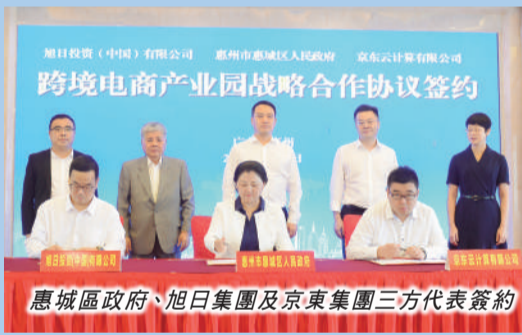
惠城區政府、旭日集團及京東集團三方代表簽約