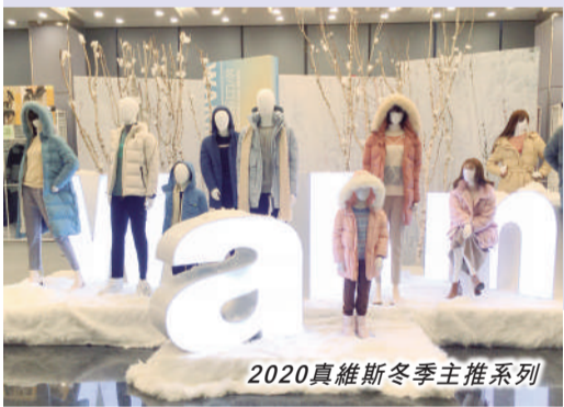
2020真維斯冬季主推系列