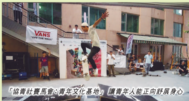
「協青社賽馬會：青年文化基地」讓青年人能正向舒展身心

在與協青社的交流分享中，集團香港公益組更加了解到社會上仍有許多青年需要他人幫助走向正軌。集團亦將秉持「窮則獨善其身，達則兼善天下」的精神，繼續關心和支助青年人的發展。 集團香港公益組