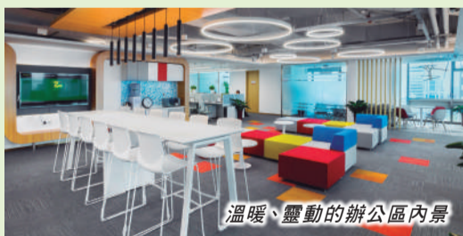
溫暖、靈動的辦公區內景

無法滿足大空間使用。常宏設計團隊通過對現有空間中色彩、企業文化的詮釋，創造出一個漂亮、簡潔、舒暢的景象空間，營造出現代簡潔的工業風。此外，常宏設計團隊根據不同空間屬性變化，點綴工銀安盛的VI(Visual Identity, 視覺識別)跳色，使整體增添親切、溫暖、靈動的感覺。並在有限的空間中，通過不同形式的傢俱組合方式，發揮空間最大效能。