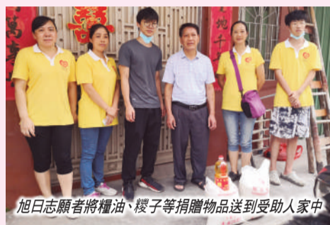
旭日志願者將糧油、糉子等捐贈物品送到受助人家中