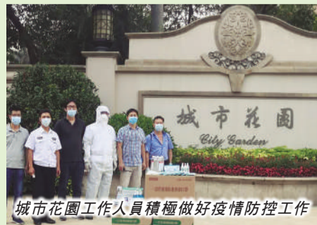
城市花園工作人員積極做好疫情防控工作