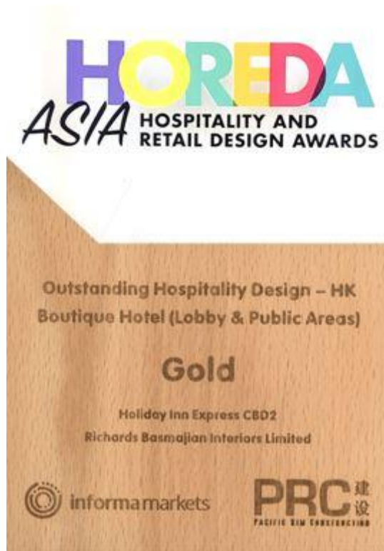
圖片說明：「傑出酒店設計」金獎證書